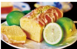
TOKYOイイシナより出展

東京都から支援を受けた実績のある出展者や、東京の食材を使ったキッチンカーなどが集まり、展示会で疲れた身体に癒しを与えます。